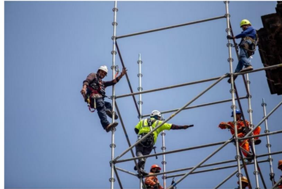
Trabajadores en Ciudad de México.

Una posible reducción de la tasa natural de desempleo es algo que deberíamos empezar a considerar en nuestros análisis de la situación macroeconómica